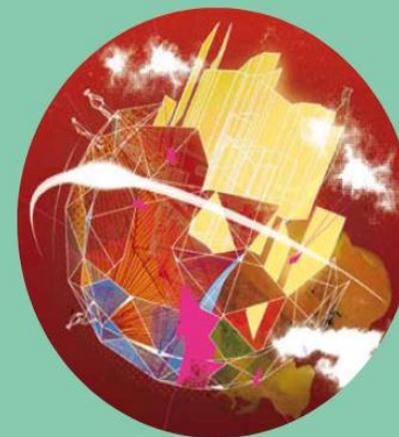
ASSISES NATIONALES DU FONCIER ET DES TERRITOIRES EN PARTENARIAT AVEC