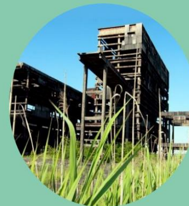
RECYCLER LES FRICHES