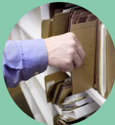
L'OPEN-DATA DU FONCIER